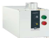
Extractor para armarios altos con control del flujo Referencia 14220