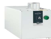
Extractor para armarios altos, sin control de flujo Referencia 14218

Sistema de recirculación con filtro ASECOS para armarios de seguridad